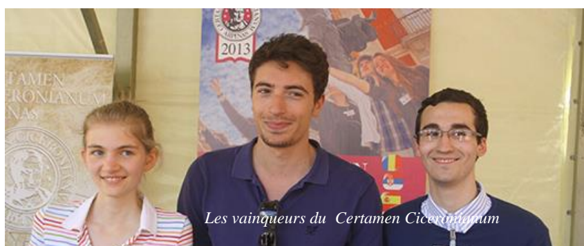
Les vainqueurs du Certamen Ciceronianum

Du 10 au 12 mai 2013 a eu lieu le XXXII e Certamen Ciceronianum Arpinas , qui a rassemblé encore cette année environ 200 élèves de la classe terminale du lycée classique, provenant de l'Italie et de 14 autres pays européens, accompagnés de 65 professeurs de disciplines classiques. Encore cette année, malgré les difficultés dues aux tensions financières toujours croissantes, qui ont forcé le Centre d'Etudes Humanistes « Marco Tullio Cicerone », organisateur du Certamen , à demander une contribution financière importante aux écoles en lice, la participation a été nombreuse, sans atteindre pour autant les nombres très élevés d'il y a quelques ans, et la réponse la plus positive est venue justement des écoles étrangères, qui ont envoyé plus de la moitié des participants. L'épreuve de latin, qui consistait comme d'habitude dans la traduction et le commentaire d'un texte cicéronien réalisés par chaque étudiant dans sa propre langue maternelle, un passage des Epistulae ad Atticum 1, 41 [2, 21] a été choisi : il s'agit d'une lettre écrite par Cicéron en 59 av. J.-C., année du consulat de Jules César et Calpurnius Bibulus, dans laquelle l'orateur arpinate déplore la triste condition de la république romaine au moment où les effets du premier triumvirat sont en