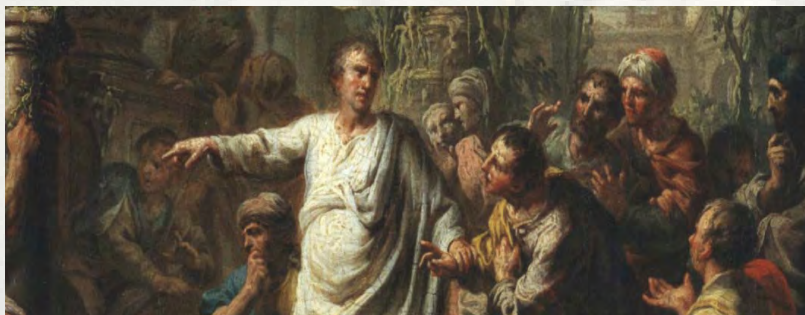
Cicerone scopre la tomba di Archimede, dipinto del pittore barocco austriaco Martin Knoller (1725-1804).